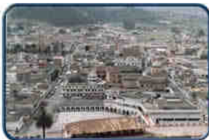
Vista panorámica de Otavalo

La ciudad de Otavalo capital del cantón está situada a 2.556 m. de altitud, a 0° 14' de latitud norte, 73° 16' longitud Greenwich y 0° 14' 30" este, según el meridiano de Quito.