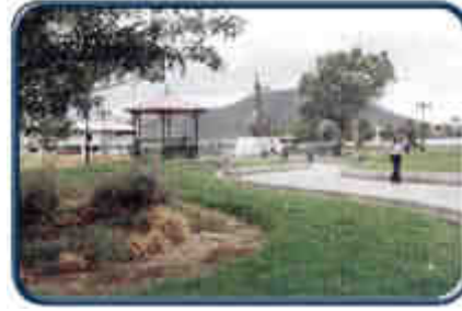
Parque de la Otavaleñidad