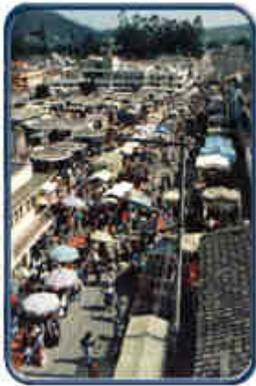
Vista panorámica Feria Sabatina

Nada hay en el país que luzca un carácter más singular que la Feria Sabatina de Otavalo. Es Otavalo una de las ciudades más emprendedoras y pintorescas del Ecuador. Posee grandes y variadas industrias; los martillos no cesan jamás; no descansan las agujas, ni las máquinas; tampoco el tremendo movimiento comercial.