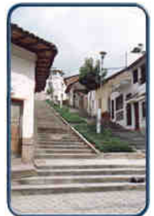
Escalinatas (Barrio el Empedrado)

cantonal, sin que se haya producido hasta hoy un antagonismo crítico entre la relación ciudad - campo, aunque el desarrollo de ésta haya ocupado para usos urbanísticos, suelos tradicionalmente dedicados a la