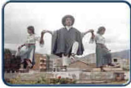
Monumento a los Danzantes