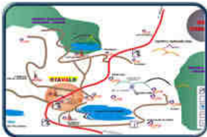
Guía Turística (Clik para Agrandar)

Vivimos rodeados de una naturaleza pródiga, llena de historias y tradiciones milenarias, en donde se conjugan la magia, el colorido y la vida que encierran sus montañas, los nevados y lagos que ennoblecen a un pueblo trabajador, creativo y unido.