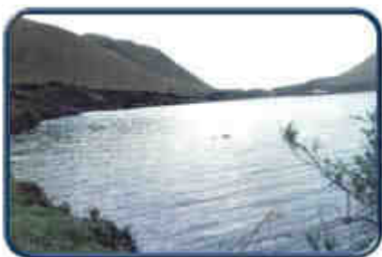
Laguna de Mojanda

En cantón Otavalo se halla regado por un sin número de ríos entre los cuales destacan : El río Quinde, el Tonglo y el Pamplona que son afluentes del río Intag, ubicados en la zona de Selva Alegre. Así también encontramos el río Azabí y el Tzalocas provenientes de las laderas del Cerro Cotacachi.