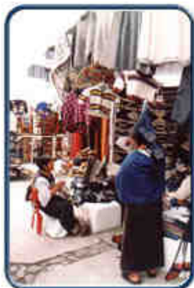
Venta de Tejidos

Carpintería Especial.- Trabajo de yugos para arados, ruedas para hilar lanas, husos de chonta, etc., se realiza en Quichinche y San Rafael.