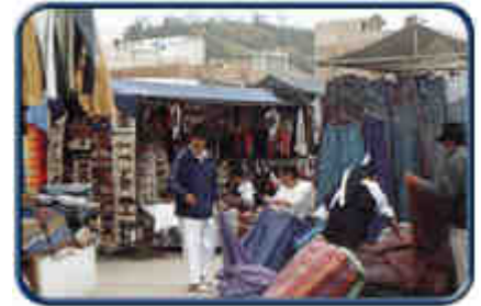
Ventas de Tejidos

La feria en esta ciudad es algo que sale de la propia entraña de la provincia, antigua y palpitante como un acelerado corazón, y que, sea lo que fuere, resulta ingrato falsearlo modificando sus detalles.