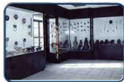
Museo del IOA

Como institución cuenta además >con una biblioteca y una producción propia sobre temas variados de la Ciudad a disposición de investigadores nacionales y extranjeros