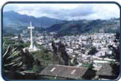
Sector Sur de Otavalo

Otavalo, es el centro alrededor del cual se activa la economía regional y ; a su vez, a donde confluyen las parroquias con su producción, funcionando en reciprocidad con todo su entorno