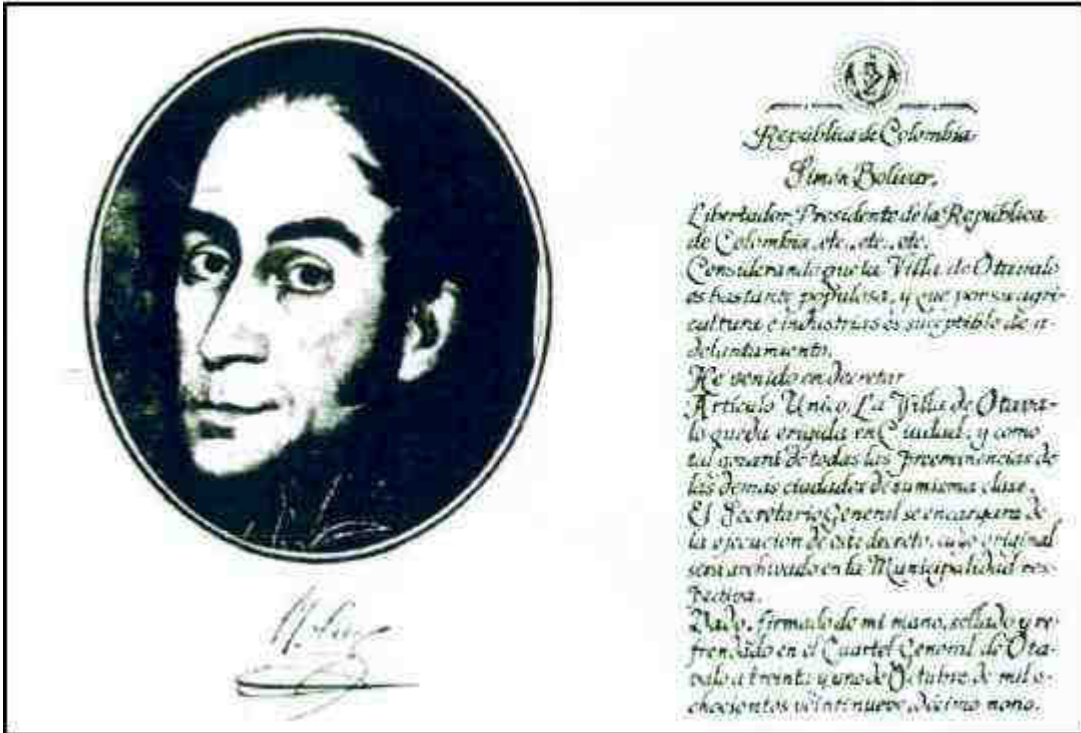
Decreto Original del Libertador Simón Bolívar