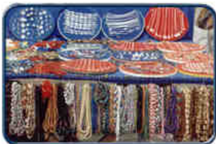
Collares y Anillos

Tallado en Cacho.- Se utiliza el cacho para peines, peinillas, peinetas, trabajo que casi ha desaparecido ante la irrupción del plástico.