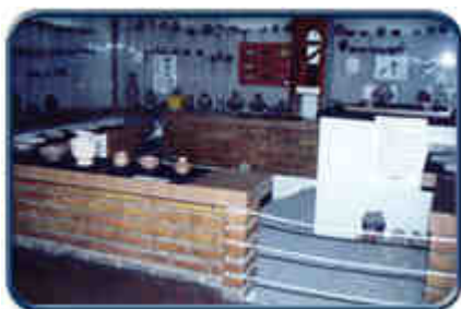
Museo del Inst. Otavaleño de Antropología

En Otavalo existen tres museos importantes : el del Instituto Otavaleño de Antropología ( I.O.A. ) que es arqueológico y étnico.