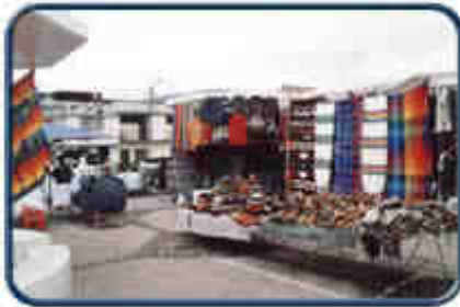
Tapices y Tejidos

La ciudad es el punto de reunión de la gente de la provincia entera, que acude tanto de los campos como de los pueblos y aldeas. Todos llegan trayendo cada cual sus productos, sus costumbres y sus trajes que decoran y demuestran su personalidad